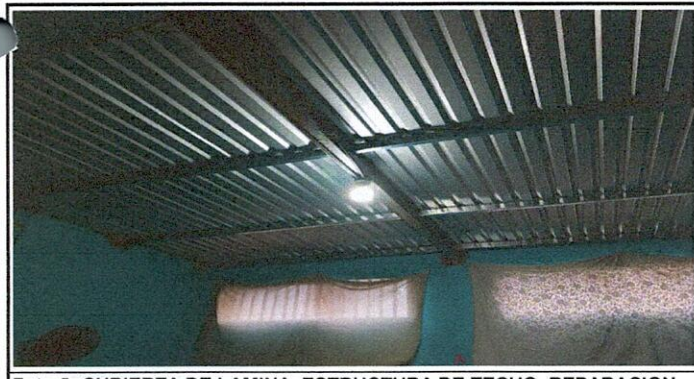
Foto 5: CUBIERTA DE LAMINA, ESTRUCTURA DE TECHO, REPARACION DEL SISTEMA ELÉCTRICO.