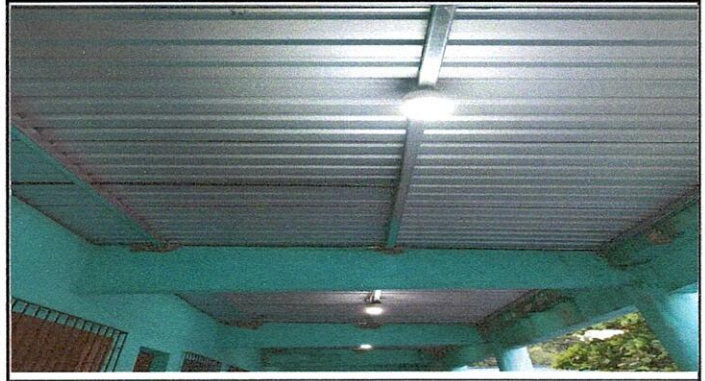
Foto2: CUBIERTA DE LAMINA, ESTRUCTURA DE TECHO, REPARACION DEL SISTEMA ELÉCTRICO.