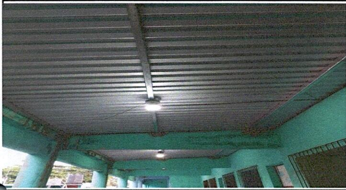
Foto1: CUBIERTA DE LAMINA, ESTRUCTURA DE TECHO, REPARACION DEL SISTEMA ELÉCTRICO.