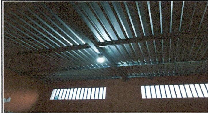
Foto 3: CUBIERTA DE LAMINA, ESTRUCTURA DE TECHO, REPARACION DEL SISTEMA ELÉCTRICO.