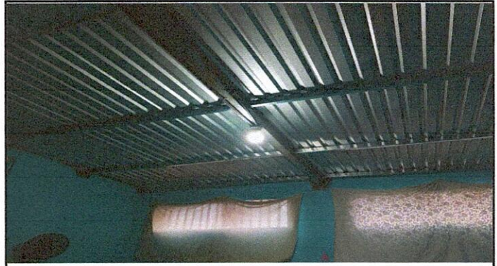
Foto 4: CUBIERTA DE LAMINA, ESTRUCTURA DE TECHO, REPARACION DEL SISTEMA ELÉCTRICO.