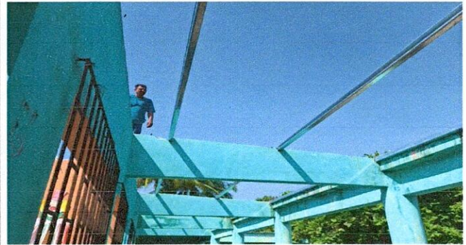
Foto2: SUSTITUCIÓN DE DUCTO ELÉCTRICO