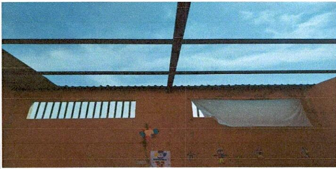
Foto 3: DESINSTALACION DE LÁMINA EXISTENTE POR LÁMINA TROQUELADA ALUZINC 26