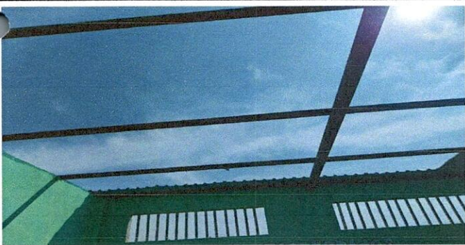
Foto 5: DESINSTALACION DE LÁMINA EXISTENTE POR LÁMINA TROQUELADA ALUZINC 26