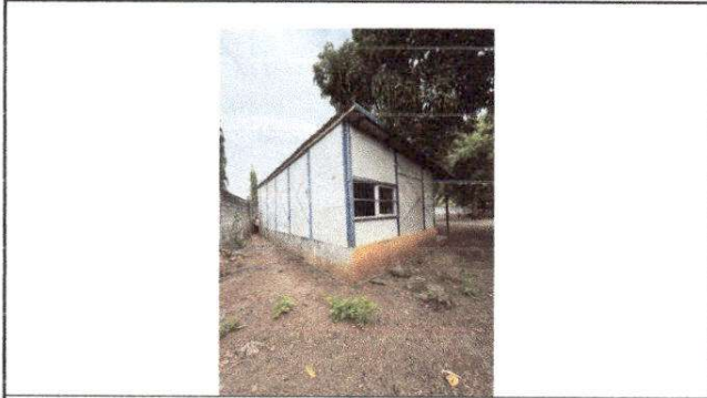
Foto1: LA ESCUELA CARECE DE CAPOTE