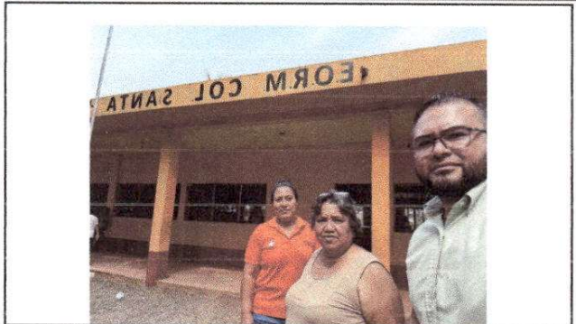
Foto 2: DE IZQUIERDA A DERECHA PRESIDENTA DE OPF, DIRECTORA DEL ESTABLECIMIENTO Y CONSULTOR A CARGO