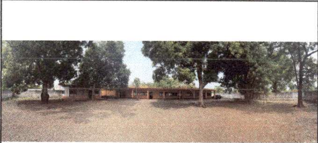
Foto 5: VISTA PANORAMICA DE LA ESCUELA DONDE SE OBSERVA QUE EL MODULO DE BAÑOS NO TIENE VENTANAS