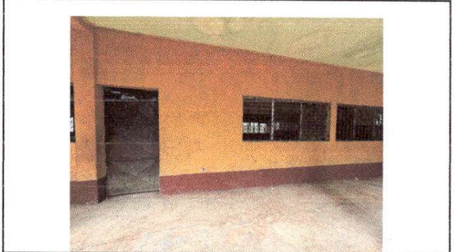
Foto 4: PUERTAS EN MAL ESTADO, PRESENTA OXIDO, PINTURA EN MUROS DAÑADA