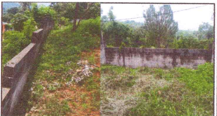
Foto 16 : Reparación de muro de contención en todo alrededor del establecimiento