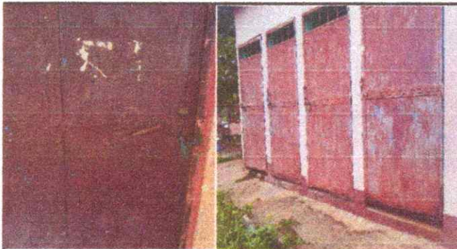
Foto 3 y 4 : sustrucción de tres chapas y sustrucción de puerta en servicio sanitario