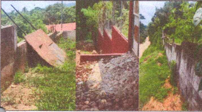
Foto 9, 10 y 11: reparación de muro perimetral de block y reparación de tubo hg malla garbanizada