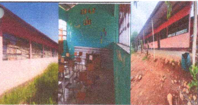
Foto 17, 18 y 19 aplicación de pintura en paredes

Observación: Si es necesario se pueden agregar hojas adicionales y actualizar el número de hojas.