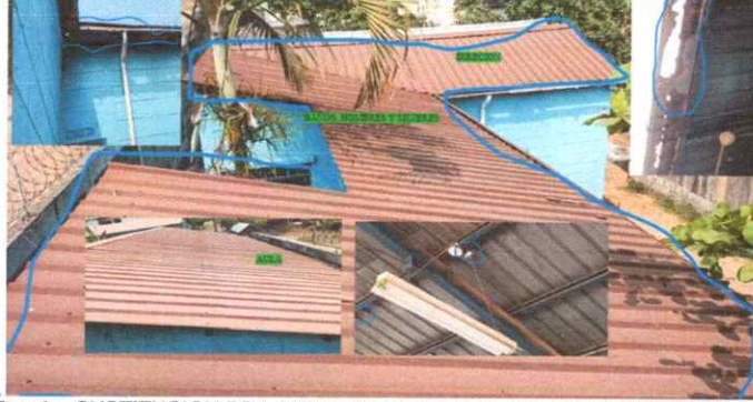
Foto1: SUSTITUCION DE LAMINA TROQUELADA ALUZINC CALIBRE 26 DE 1 AULA BAÑOS HOMBRES-MUJERES Y LA DIRECCION.