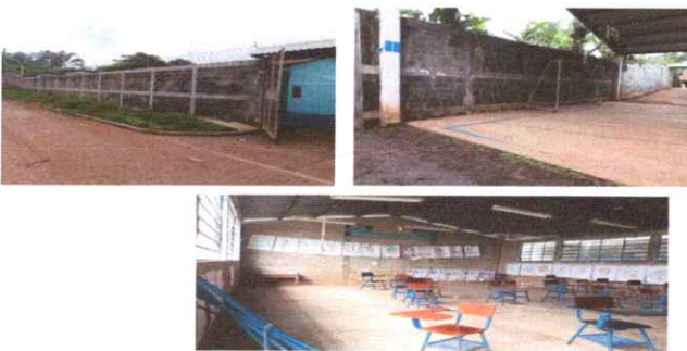
Foto 5: PINTURA EN MUROS PERIMETRALES EXTERIORES Y INTERIORES, PINTURA DE PAREDES DE ALBAÑILERIA INTERIORES Y EXTERIORES.