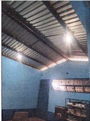
Foto 3: Mantenimiento a estructura (lijado, cambio de tubo , cepillado, sujeciones, aplicación de pintura) a puertas, Sustitución de chapa, Sustitución de puerta y sustitución de balcones de metal