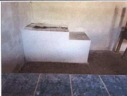
Foto 5: Reparación de cocina, ustitución de tubería PVC línea principal aguas negras, Sustitución de caja de registro, Sustitución de tubería línea principal, y Sustitución de chorro.