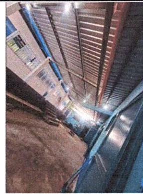
Foto 2: Mantenimiento a estructura de soporte de metal y Reparación de sistema eléctrico