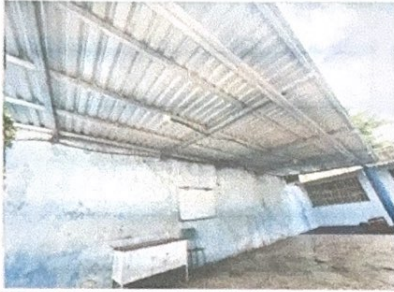
Foto 7: Sustitución de estructura y cubierta de lamina en escenarios