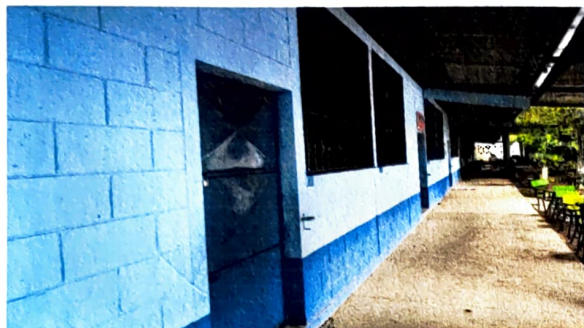
Foto1: 5.1 MANTENIMIENTO A ESTRUCTURA DE METAL DE VENTANA