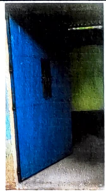
Foto 4: 2.3 SUSTITUCIÓN DE ESTRUCTURA DE PUERTAS DE METAL, ESTADO ACTUAL