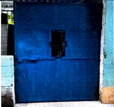
Foto 3: 2.3 SUSTITUCIÓN DE ESTRUCTURA DE PUERTAS DE METAL, ESTADO ACTUAL