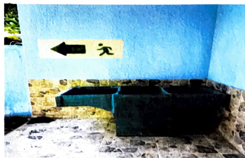
Foto 6: 20.1 SUSTITUCIÓN DE PILA DE CEMENTO DE DOS LAVADEROS 14.13 SUSTITUCIÓN DE CHORRO

Observación: Si es necesario se pueden agregar hojas adicionales y actualizar el número de hojas.