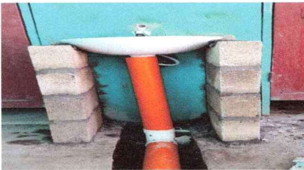
Foto 5: 10 SERVICIOS SANITARIOS Y SUS ACCESORIOS 10.5 Sustitución lavamanos