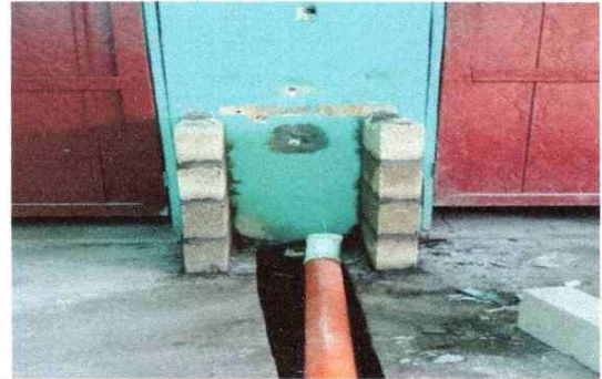
Foto 4: 10 SERVICIOS SANITARIOS Y SUS ACCESORIOS 10.5 Sustitución lavamanos