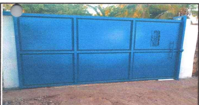
Foto 5: 19 MANO DE OBRA ESCIALIZADA (ALBAÑILERIA, HERRERIA, ELECTRICIDAD Y PLOMERIA) 19.5 Fabricación e instalación de portón de metal de ingreso