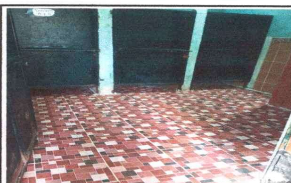
Foto 4: 6 PISO 6.8 Sustitución de piso cerámico 13 SUSTUTUCION DE AZULEJO 13.1 Sustitución de azulejo