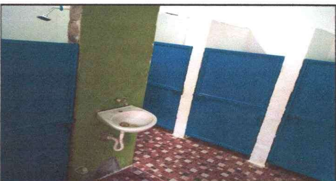
Foto 3: 4 PUERTAS DE METAL 3.3 Sustitución de puertas en sercios sanitarios