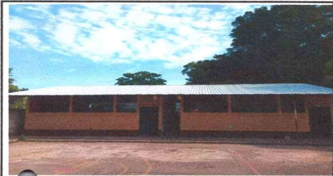
Foto 1: 1 CUBIERTA DE LAMINA 1.1 Sustitución de lámina, troquelada aluzinc calibre 26 1.3 Sustitución de elementos de fijación