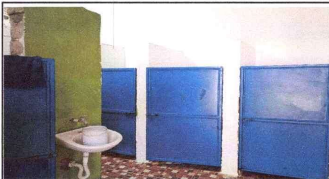
Foto 3: 4 PUERTAS DE METAL 3.3 Sustitución de puertas en sercios sanitarios