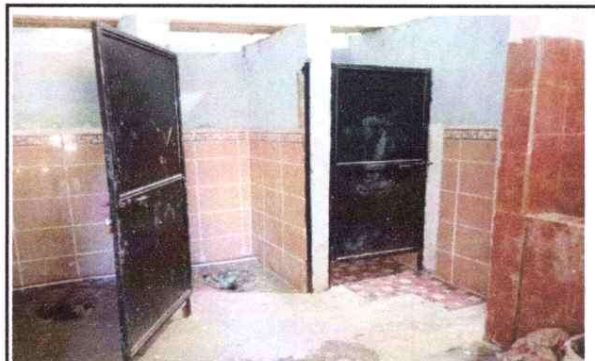
Foto 4: 6 PISO 6.8 Sustitución de piso cerámico 13 SUSTITUCION DE AZULEJO 13.1 Sustitución de azulejo