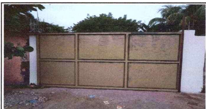
Foto 5: 19 MANO DE OBRA ESCIALIZADA (ALBAÑILERIA, HERRERIA, ELECTRICIDAD Y PLOMERIA) 19.5 Fabricación e instalación de portón de metal de ingreso