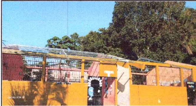
Foto 1: 1 CUBIERTA DE LAMINA 1.1 Sustitución de lámina, troquelada aluzinc calibre 26 1.3 Sustitución de elementos de fijación