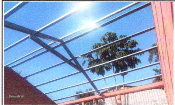
Foto 2: 2 ESTRUCTURA DE TECHO 2.3 Sustitución de soporte de metal por metal