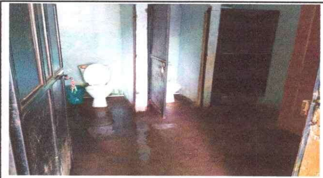
Foto 4: 6 PISO 6.8 Sustitución de piso cerámico 13 SUSTITUCIÓN DE AZULEJO 13.1 Sustitución de azulejo