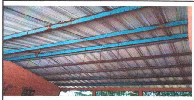
Foto 2: 2 ESTRUCTURA DE TECHO 2.3 Sustitución de estructura de soporte de metal, por metal.