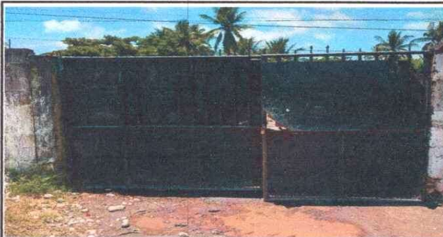
Foto 5: 19 MANO DE OBRA ESPECIALIZADA (ALBAÑILERÍA, HERRERIA, ELECTRICIDAD Y PLOMERIA) 19.5 Fabricación e instalación de portón de metal de ingreso