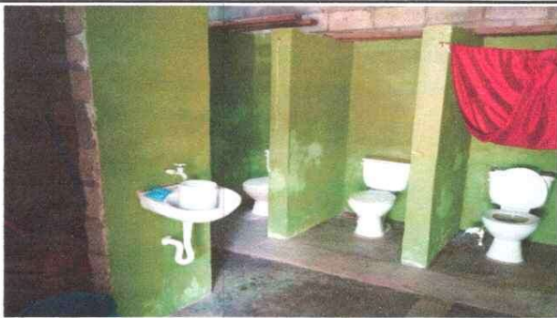
Foto 3: 4 PUERTAS DE METAL 4.4 Sustitución de puertas en servicios sanitarios