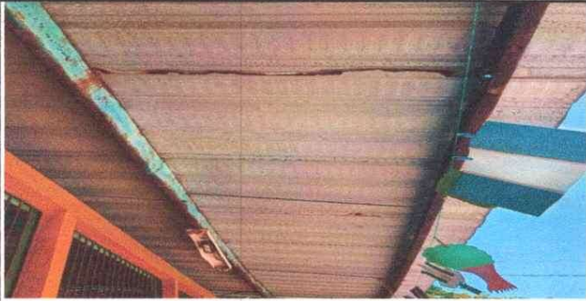
Foto 1: 1 CUBIERTA DE LAMINA 1.1 Sustitución de lámina, por lámina troquelada aluzinc calibre 26 1.3 Sustitución de elementos de fijación