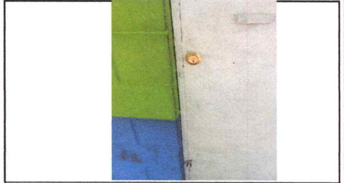
Foto 2. Puertas de metal 4.2 Sustitución de chapa