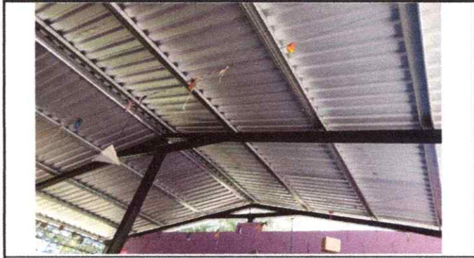
Foto 1: 1. Cubierta de lámina 1.1 Sustitución de lámina troquelada Aluzinc calibre 26. 2. Estructura de techo 2.3 Sustitución de estructura de soporte de metal, por metal.