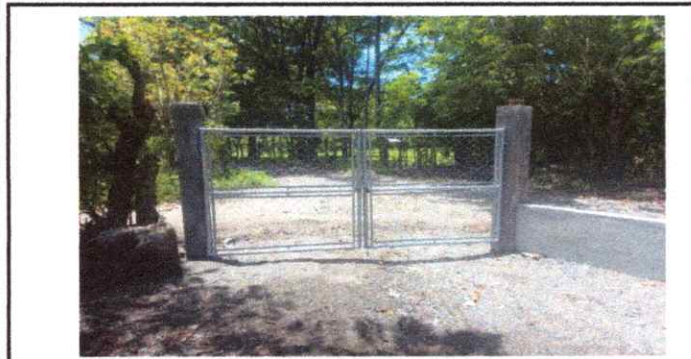
Foto 5: 19. Mano de obra especializada (albañilería, herrería, electricidad y plomería) 19.5 Fabricación e instalación de portón de metal de ingreso.