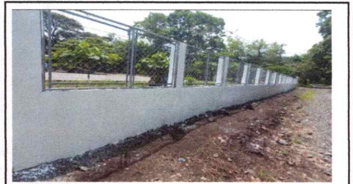
Foto 4: 15 Muros perimetrales 15.2 Reparación de muro perimetral de block con tubo hg y malla galvanizada, soleras intermedias y columnas.