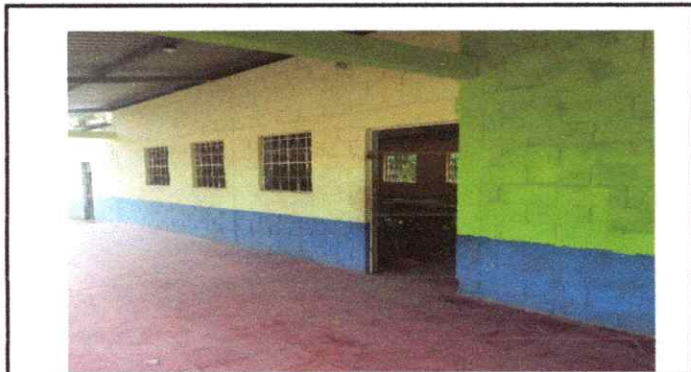
Foto 3: 9. Pintura en muros exteriores e interiores. 9.1 Pintura en muros exteriores e interiores