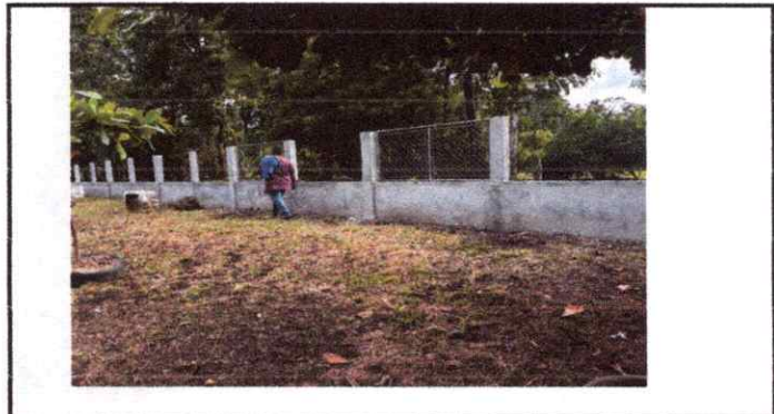
Foto 4: 15 Muros perimetrales 15.2 Reparación de muro perimetral de block con tubo hg y malla galvanizada, soleras intermedias y columnas.