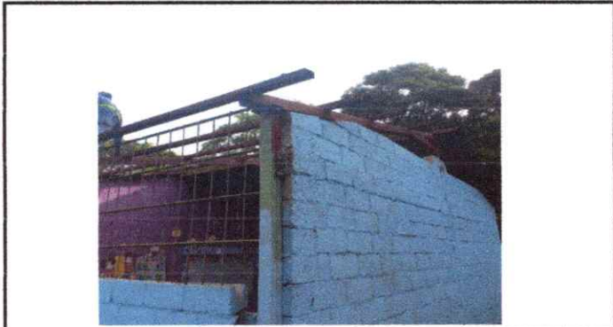
Foto 1: 1. Cubierta de lámina 1.1 Sustitución de lámina troquelada Aluzinc calibre 26. 2. Estructura de techo 2.3 Sustitución de estructura de soporte de metal, por metal.