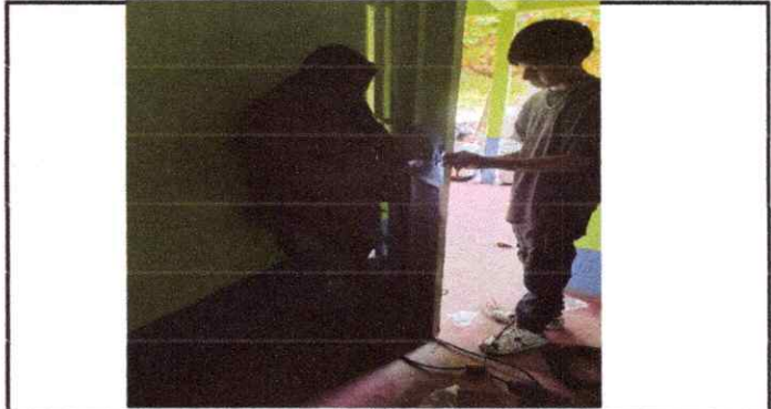
Foto 2. Puertas de metal 4.2 Sustitución de chapa