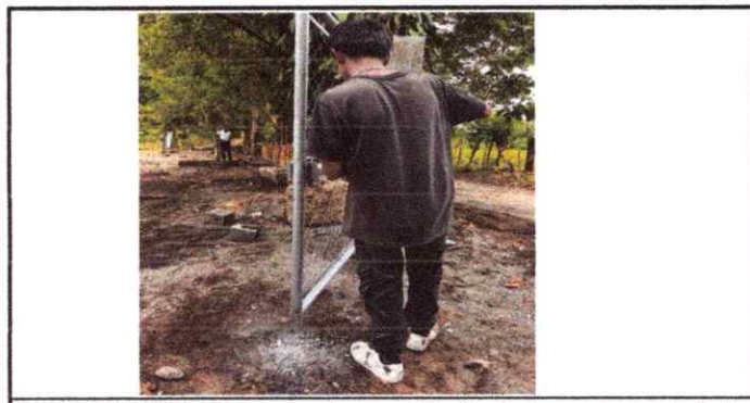
Foto 5: 19. Mano de obra especializada (albañilería, herrería, electricidad y plomería) 19.5 Fabricación e instalación de portón de metal de ingreso.