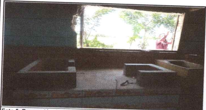
Foto 5: Reparación de repello y cernido de paredes (repello de muro).