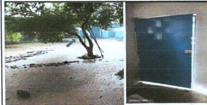
Foto 5: PUERTA DE METAL; Mantenimiento a estructura (lijado, cambio de tubo, cepillado, sujeciones, aplicación de pintura). Sustitución de chapa. (Puerta peatonal) y Sustitución de puerta de metal en área de la cocina.