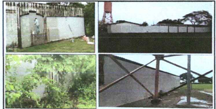
Foto 6: REPARACIÓN DE REPELLO Y CERNIDO DE PAREDES (cuando aplique; Repello en muro en perímetro del instituto

Observación: Si es necesario se pueden agregar hojas adicionales y actualizar el número de hojas.