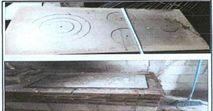
Foto 4: REPARACIÓN DE COCINA; Sustitución de plancha de metal de 3 hornillas. Y Sustitución de de chimenea de metal