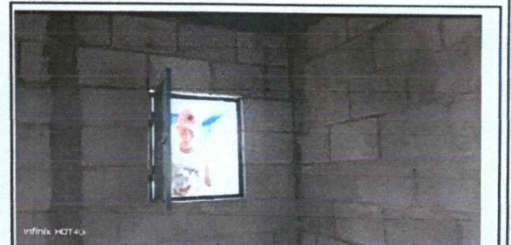
Foto 6: VENTANAS; Sustitución de ventana de madera por metal más vidrio

Observación: Si es necesario se pueden agregar hojas adicionales y actualizar el número de hojas.