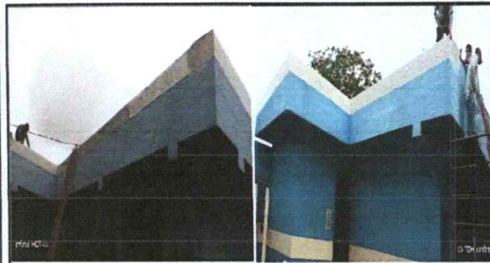
Foto 3: Instalación de lámina para protección de filtración en unión de techo y muro. (área de terraza)