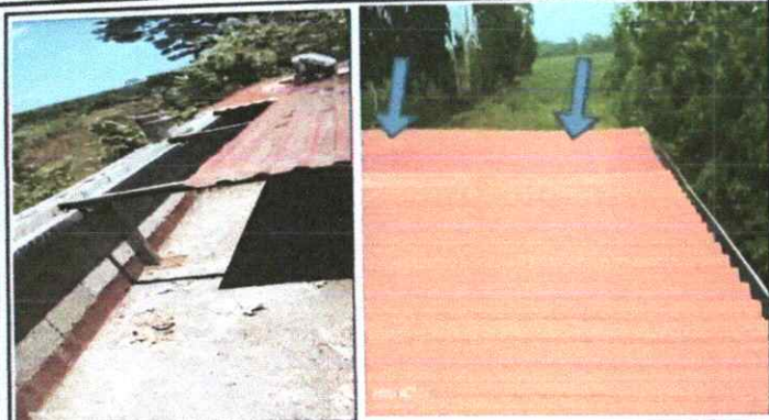
Foto 1: CUBIERTA DE LÁMINA, Sustitución de 17 mts cuadrados de lámina nueva troquelada en la terraza. (pegado al cañal, parte exterior)