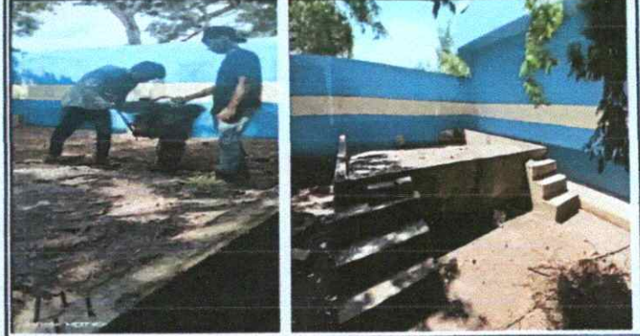
Foto 2: Sustitución de piso de torta de concreto (área del escenario)