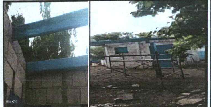
Foto 4: ESTRUCTURA DE TECHO; Sustitución de estructura de soporte de metal por metal. (Área de la cocina)