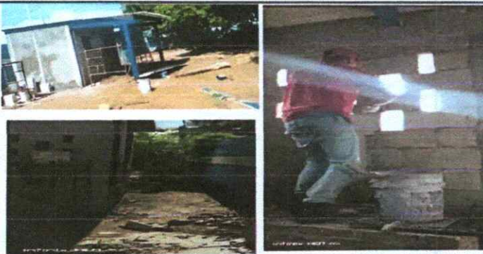
Foto 5: REPARACIÓN DE REPELLO Y CERNIDO DE PAREDES (cuando aplique; Repello en muro en área de la cocina