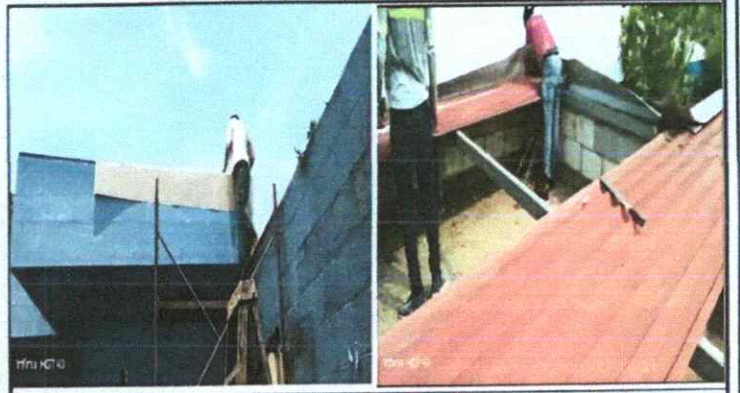
Foto 2: Instalación de lámina para protección de filtración en unión de techo y muro