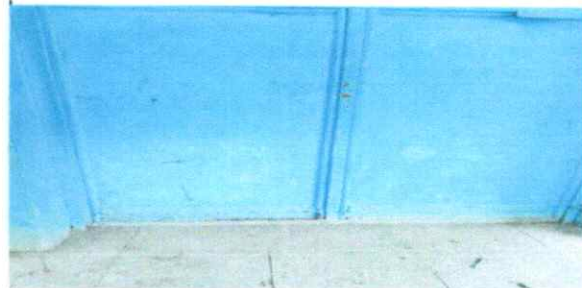
FOTO 4. SUSTITUCION DE PUERTAS