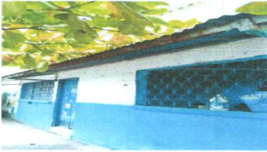
Foto1: CUBIERTA DE LAMINA/ ESTRUCTURA DE TECHO