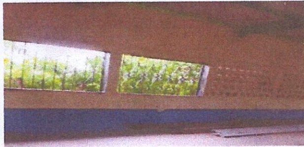
Foto1: Cubierta de lámina salón de aula