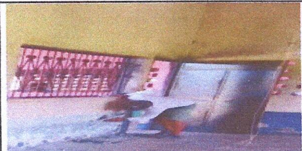
Foto 6: Mantenimiento a estructura metálica en puerta y cambio de pasadores

Observación: Si es necesario se pueden agregar hojas adicionales y actualizar el número de hojas.