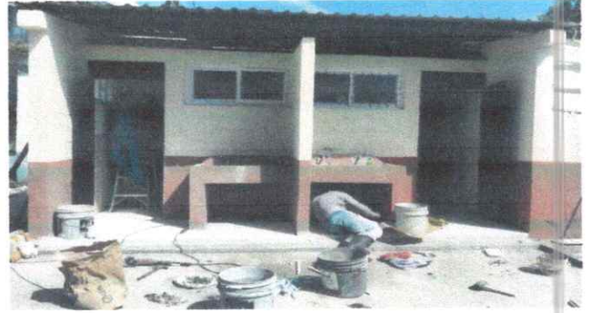
Foto 2: MODULOS DE BAÑOS: Se observa que estan colocando el piso.