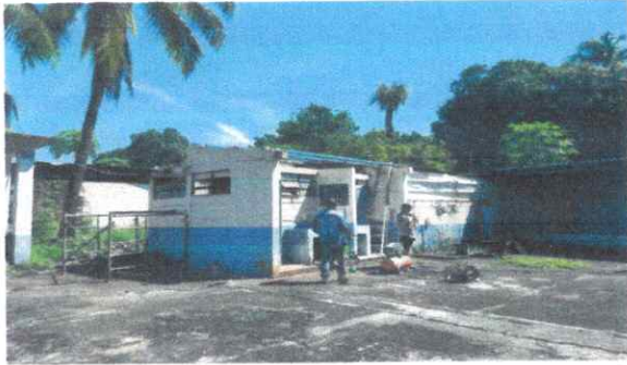
Foto1: MODULO DE BAÑOS: Se observa que se esta reparando el techo