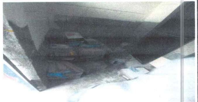
Foto 4: MODULO DE BAÑOS: Pintando el interior del baño , quitando la humedad de los muros.