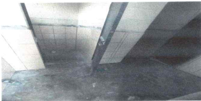
Foto 5: MODULOS DE BAÑOS: Colocación de azulejos ,mantenimiento de pintura