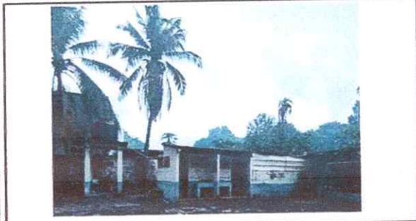
Foto1: Modulo BAÑOS 2. Se observa el área de baños 2, en mal estado, fuera de servicio.