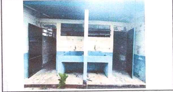
Foto 2: Modulo BAÑOS 2. SE observa el área en mal estado los lavamanos no cuenta con chorros.