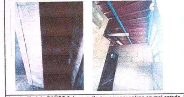
Foto 6: Modulo BAÑOS 2. Los sanitarios se encuentran en mal estado, la estructura metálica y cubierta de lámina se encuentra en malas condiciones con oxido en el material.

Observación: Si es necesario se pueden agregar hojas adicionales y actualizar el número de hojas.