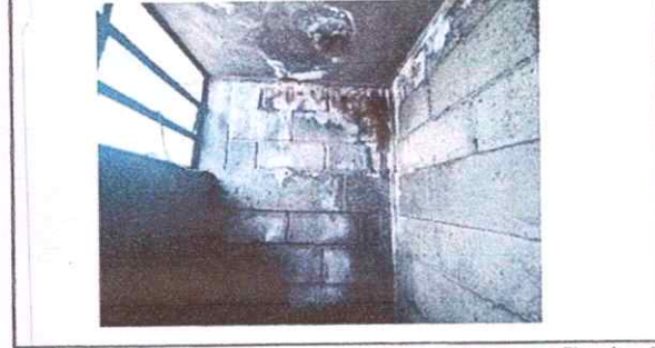
Foto 4: Modulo BAÑOS 2. Se observa el interior del baño con filtración de humedad en losa y muros.