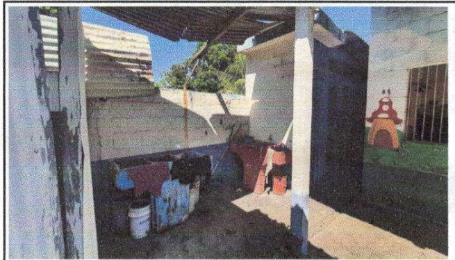
Foto 4: AREA DE PILA Y DONDE SE COLOCARÁ LAVAMANOS FUNDIDO PARA NIÑOS