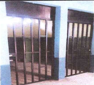
Foto 7: Fabricación e instalación de puertas de rejas en baños de varones