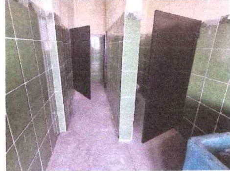
Foto 6: Fabricación e instalación de puertas de metal en tres baños del segundo nivel.

Observación: Si es necesario se pueden agregar hojas adicionales y actualizar el número de hojas.