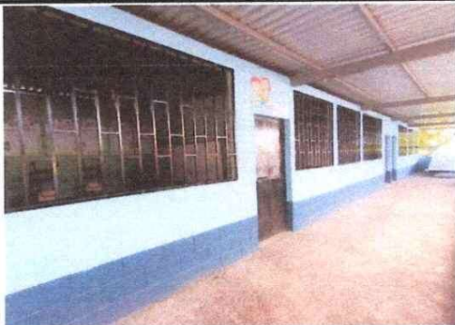
Foto 5: Fabricación e instalación de balcones en hierro en ventana en los salones del segundo nivel