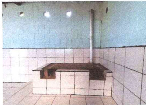
Foto 8: Sustitución de estufa rural (completo) incluye chimenea y plancha de metal