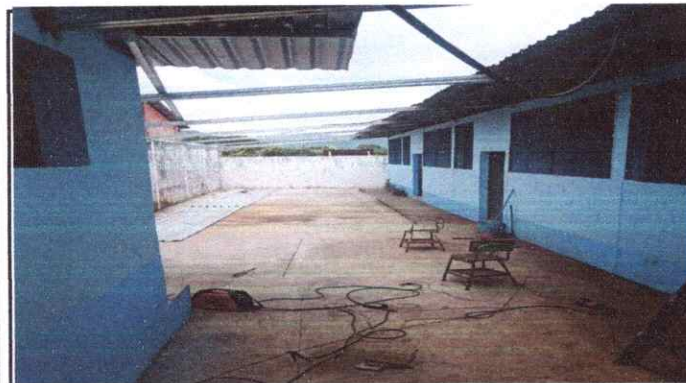
Foto : AREA DONDE SERA EL TECHADO DE COMEDOR