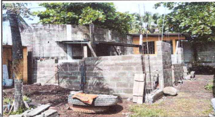
Foto1: AREA DONDE ESTARA LA COCINA