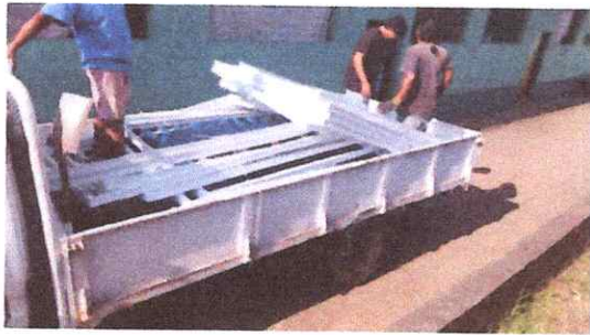
Foto1: 1.1 material de ventana-balcon.