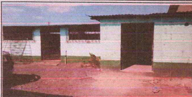
Foto1: Remozamiento de cocina , cubierta de lamina , estructura de soporte de metal , paredes ,pintura,puerta,ventanas y balcones.