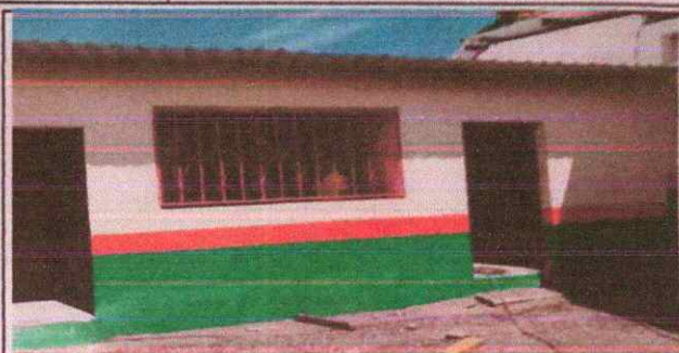
Foto 2: Remozamiento de Bodega de cocina , cubierta de lamina , estructura de soporte de metal ,paredes, pintura de muros y puerta .