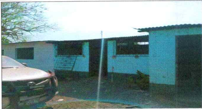
Foto 1. Remozamiento de Cocina, Cubierta de lamina, estructura de soporte de metal, paredes, pintura, puerta, ventanas y balcones.