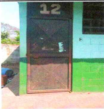
Foto 3. Remozamiento de Puerta de Aula No. 12