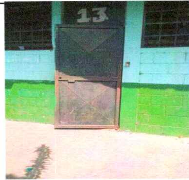
Foto 4. Remozamiento de Puerta de Aula No. 13