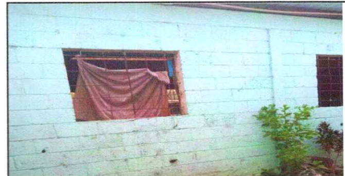
Foto Remozamiento de Balcon en aulas.

Observación: Si es necesario se pueden agregar hojas adicionales y autorizar el número de hojas.