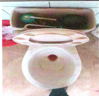
Foto No. 5 Remozamiento de accesorios de tanque de inodoro.