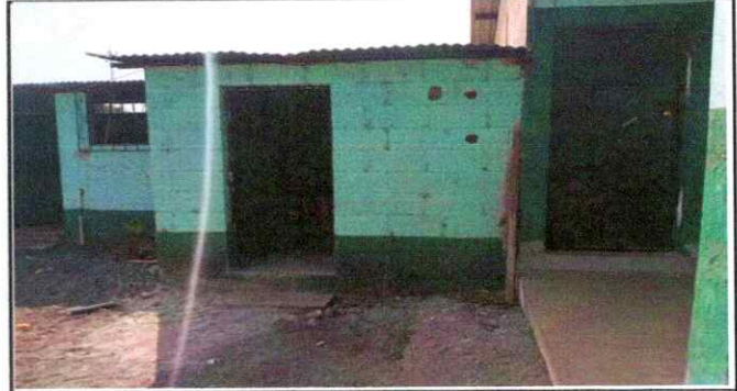
Foto 2. Remozamiento de Bodega de Cocina, cubierta de lamina, estructura de soporte de metal, paredes, pintura de muros y puerta.