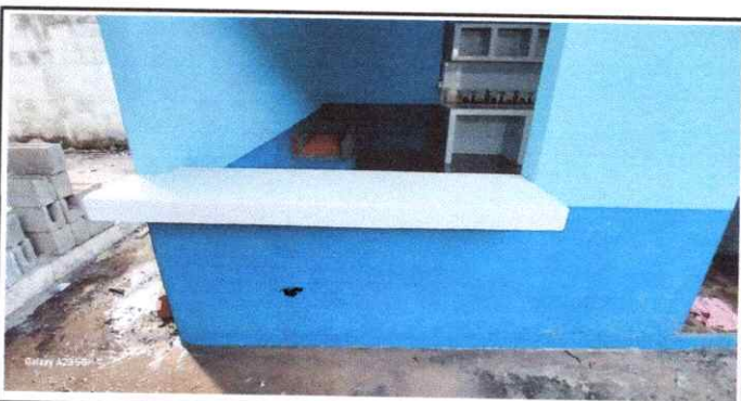
Foto 5: Aplicación de Pintura en paredes interiores y exteriores de cocina