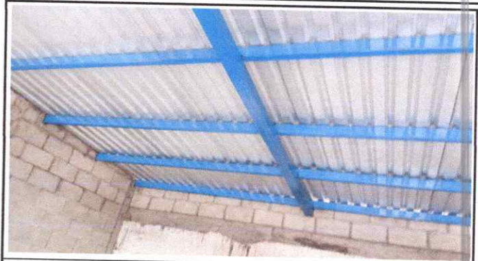
Foto 2: Sustitución de soporte de metal por metal en modulo de cocina