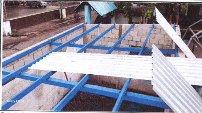
Foto 1: Sustitución de lamina por lamina troquelada de aluzinc calibre 26 en modulo de cocina