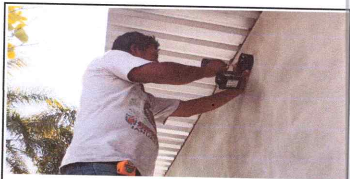
Foto 6: Reparacion y mantenimiento del sistema electrico en cocina.

Observación: Si es necesario se pueden agregar hojas adicionales y actualizar el número de hojas.