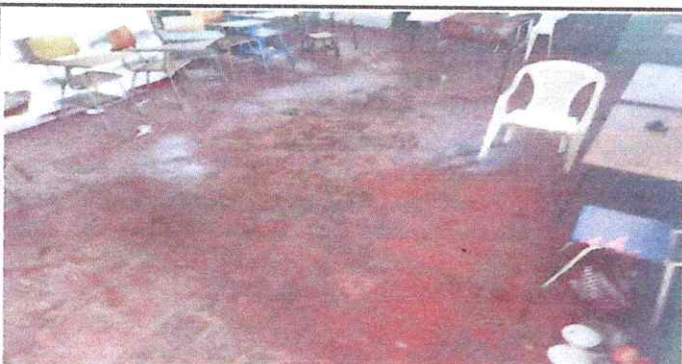
Foto 5: Sustitución de piso de granito por piso cerámico antideslizante del área de la cocina, como mejorar la estufa rural y su chimenea, como el tanque o pileta que se encuentran para el uso de la cocina.