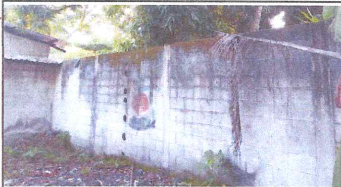
Foto 3: Levantar dos bloques más de block y colocar rasor, con la finalidad de asegurar la Escuela y tapar los agujeros con cemento.