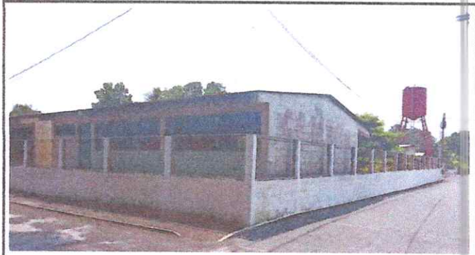
Foto 2: Sustitución de malla por pared (block), levantar dos bloques más y colocar rasor, con la finalidad de asegurar la Escuela. Sernido y pintura en el exterior.