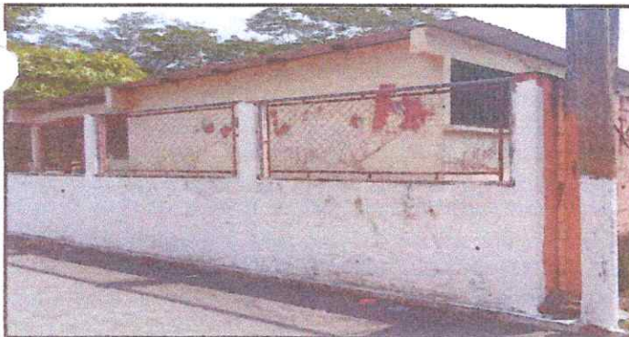
Foto 5: Sustitución de malla por pared (block), levantar dos bloques más y colocar rasor, con la finalidad de asegurar la Escuela. Sernido y pintura en el exterior.