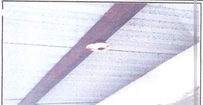
Foto 2: Sustitución de bombillas y reflectores y cambio de elementos deteriorados o dañados (cables, plafoneras, apagadores, etc.)