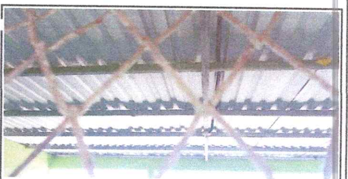
Foto 6: Sustitución de una lámina, con sus respectivos elementos de fijación (tornillos)

Observación: Si es necesario se pueden agregar hojas adicionales y activar el campo de hojas.