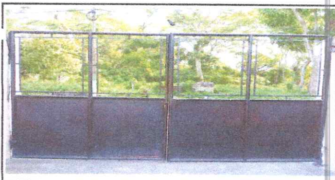
Foto 6: Mantenimiento del portón, sustitución de lámina y sustituir malla por lámina y su respectiva pintada. (Quedará todo cubierto o cerrado)

Observación: Si es necesario se pueden agregar hojas adicionales y el número de hojas.