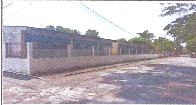
Foto 1: Sustitución de malla por pared (block), levantar dos bloques más y colocar rasor, con la finalidad de asegurar la Escuela. Sernido y pintura en el exterior.