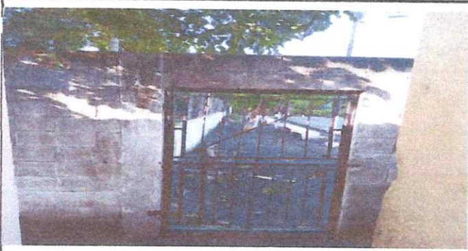
Foto 1: Quitar la puerta y cerrar por completo con block, para que exista una sola entrada.