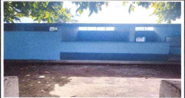
Foto 4: SUSTITUCION DE VENTANA DE VIDRIO POR MURO DE BLOCK EN MÓDULO DE AULA.