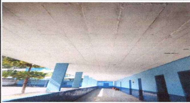
Foto1: PINTURA DE MUROS EXTERIORES.