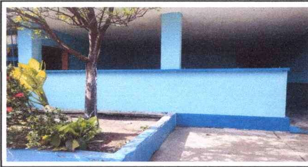
Foto 5: SUSTITUCION DE VENTANA DE VIDRIO POR MURO DE BLOCK EN MÓDULO DE AULA.