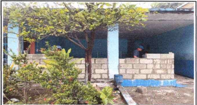
Foto 4: SUSTITUCION DE VENTANAS DE VIDRIO POR MURO DE BLOCK EN MÓDULO DE AULA.