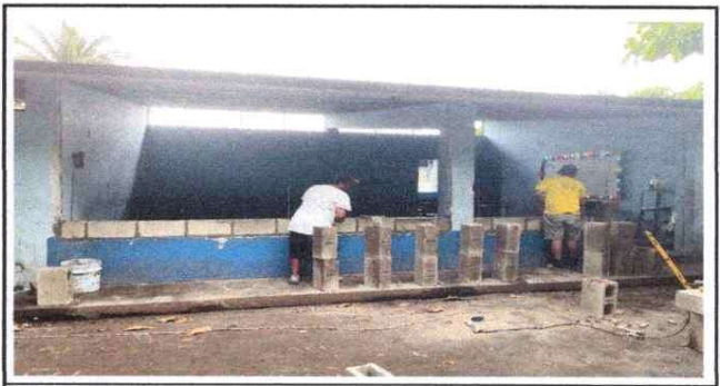
Foto 6: SUSTITUCION DE VENTANAS DE VIDRIO POR MURO DE BLOCK EN MÓDULO DE AULA.

Observación: Si es necesario se pueden agregar hojas adicionales y actualizar el número de hojas.