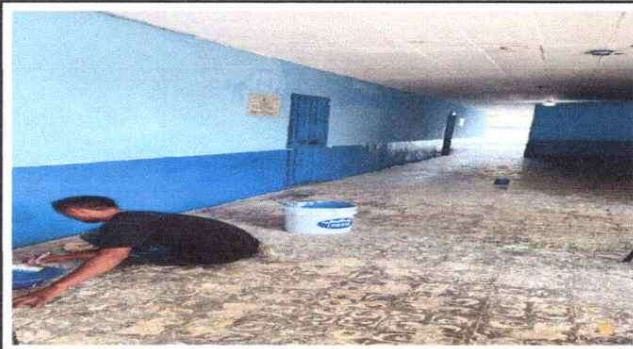
Foto1: PINTURA DE MUROS EXTERIORES.