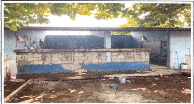
Foto 2: SUSTITUCION DE VENTANAS DE VIDRIO POR MURO DE BLOCK EN MÓDULO DE AULA.