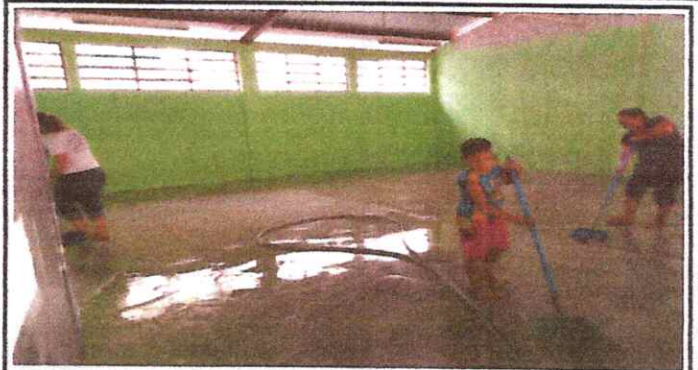
Foto 2: FINALIZACIÓN DE PISO DE TORTA A LOS TRES SALONES LADO IZQUIERDO.