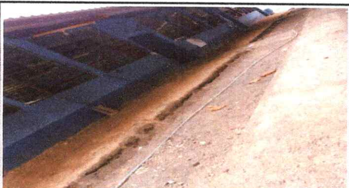
Foto 4: REALIZACIÓN DE CUNETAS DE TORTA DE PISO LADO IZQUIERDO Y DERECHA.