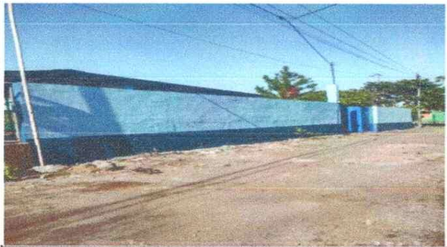
Foto 3: Reparacion de Muro Perimetral de Block y aplicacion de pintura