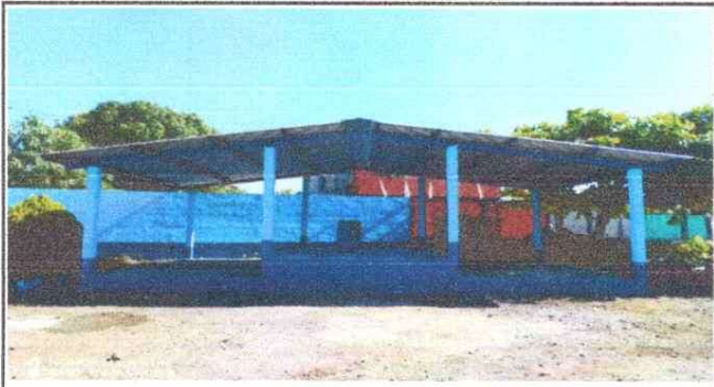
Foto 1: Cambio de lamina y estructura de soporte de metal. Sustitucion de torta de piso