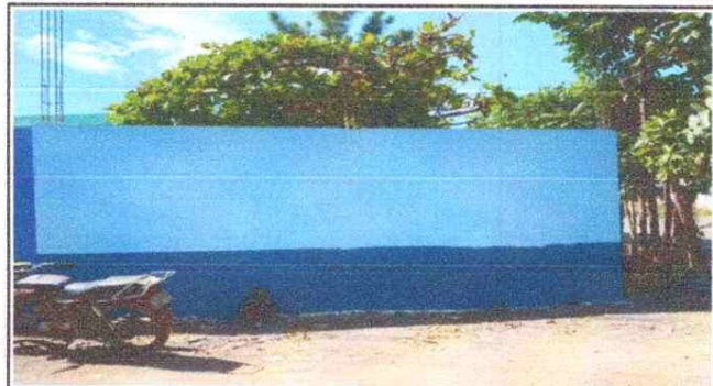
Foto 2: Reparacion de muro perimetral de block y aplicacion de pintura.