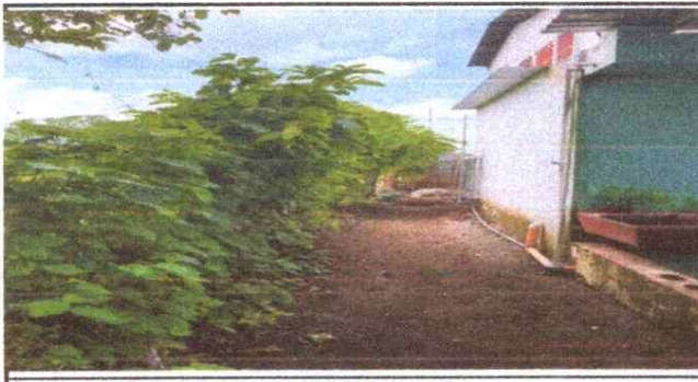
Foto 5. Reparación de muro perimetral de block