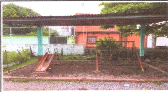
Foto.1 Sustitución de lámina por lámina troquelada , soporte de metal e instalación de piso de torta en área recreativa y escenario.