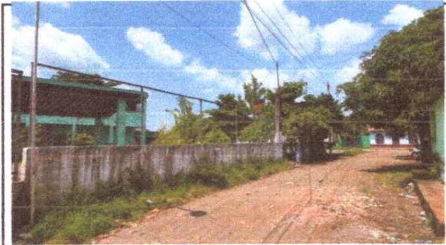
Foto 3. 15.1 Reparación de Muro Perimetral de block.