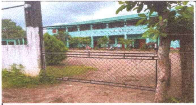
Foto 4. Fabricación de sustitución de portón de metal.