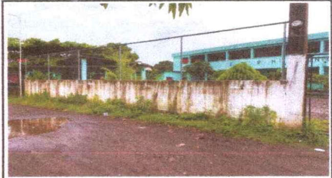
Foto. 2 15.1 Reparación de Muro Perimetral de block .