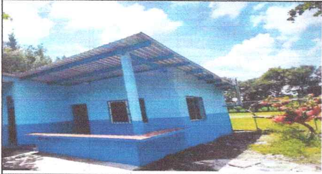
Foto 1. Remozamiento de Cocina