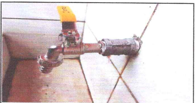
Foto 4. Sustitución de Llaves de chorro y reparación de drenaje de lavamos colectivo.