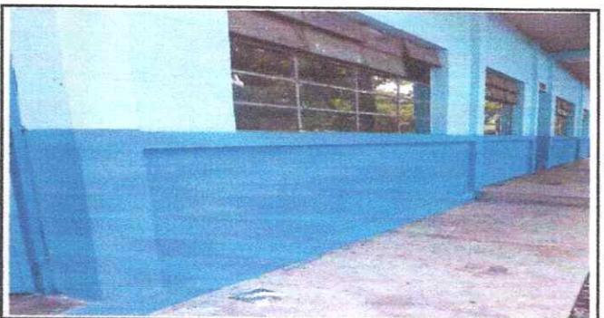
Foto 6. Aplicación de pintura en muros interiores y exteriores.

Observación: Si es necesario se pueden agregar hojas adicionales y actualizar el número de hojas.