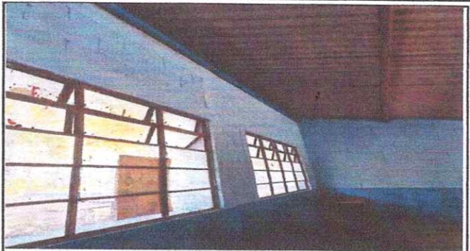
Foto 2. Sustitución de Costaneras en aulas