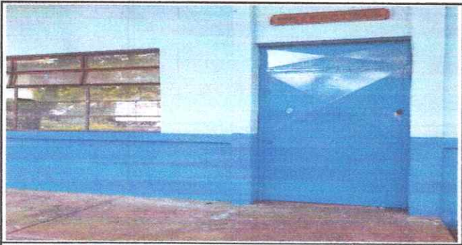
Foto 5. Mantenimiento de estructura de puertas de metal de aulas (lijado, cambio de tubo, cepillado, sujeciones y aplicación de pintura.