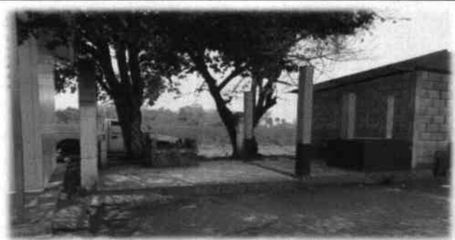
Foto 6: Se Cambiará e instalará en este lugar, las dos pilas de dos lavaderos, se aprovechará este lugar.