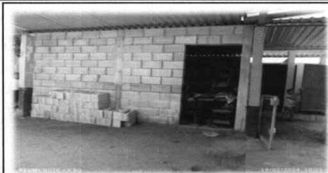
Foto7: Mejoramiento de cocina, incluye remozamiento de estufa de leña rural mas chimenea, muebles de cocina y azulejo. Actualmente por falta de estas mejoras lo utilizan como una segunda bodega.