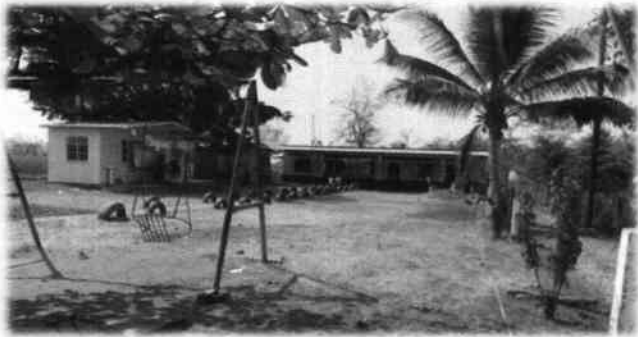
Foto1: Escuela Oficial Rural Mixta, caserío El Campamento.