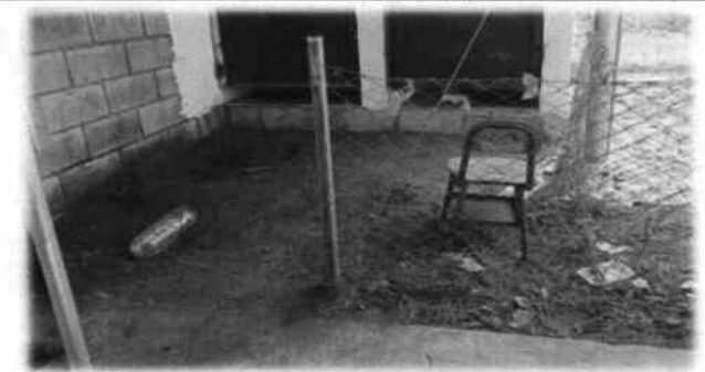
Foto 5: Mejoramiento del módulo de baños con el cambio del piso de torta de concreto, cambio e instalación del piso cerámico y del azulejo.