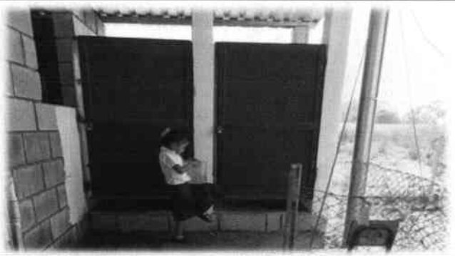
Foto 3: Se Evaluó la necesidad de reparar y darle mantenimiento a las puertas metálicas.