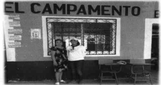
Foto 2: Presidente de la OPF y Evaluadora de Campo, realizando la visita técnica, para identificar las necesidades con mayor prioridad.