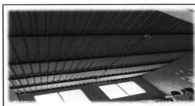
Foto 12: Mejoramiento del sistema eléctrico (fuerza e iluminación), se incluirá también la revisión de los circuitos y sustituir algunos de los accesorios por aula.