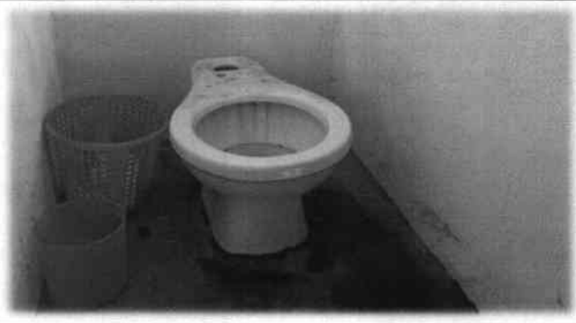
Foto 4: Una de las necesidades que se evaluarán en este modulo, es el cambio de los inodoros.