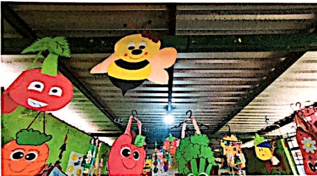
Foto 9: Cambio e instalación de lamina por lamina troquelada aluzinc calibre 26 (incluye tornillos) en 4to módulo de aulas. Finalizado al 100%