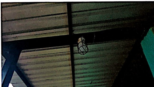
Foto 11: Se observan las protecciones colocadas en los focos de los pasillos para evitar robos, finalizado al 100%