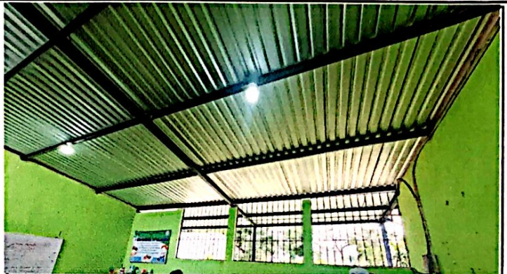
Foto 2: Cambio e instalación de lamina por lamina troquelada aluzinc calibre 26 (incluye tornillos) en el 1er módulo de aulas, finalizado al 100%