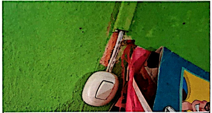
Foto 8: Reparación de circuito electrico iluminación y fuerza ( incluye ducto o tubo PVC, plafoneras con focos ahorradores alta potencia, abrazaderas cables, interruptores y tomacorrientes en 3er módulo de aulas.