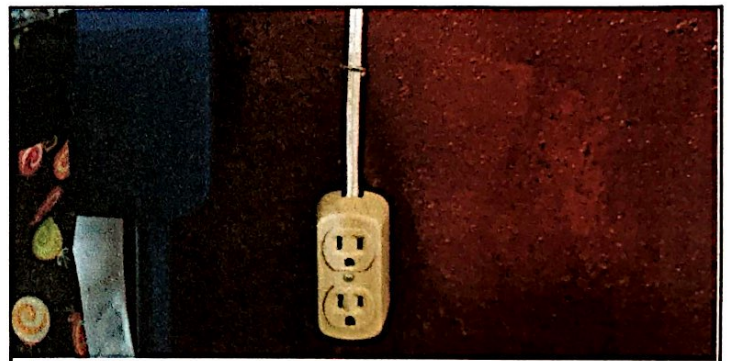
Foto 10: Reparación de circuito electrico iluminación y fuerza ( incluye ducto o tubo PVC, plafoneras con focos ahorradores alta potencia, abrazaderas cables, interruptores y tomacorrientes en 4to módulo de aulas. Finalizado al 100%