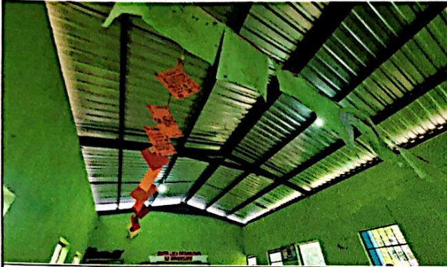
Foto7: Cambio e instalación de lamina por lamina troquelada aluzinc calibre 26 (incluye tornillos) en 3er módulo de aulas.