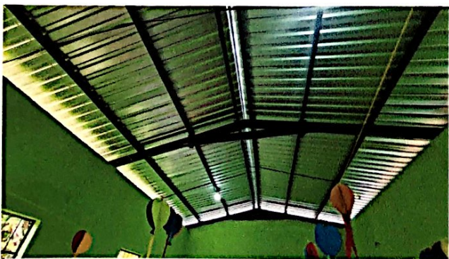
Foto 5: Cambio e instalación de lamina por lamina troquelada aluzinc calibre 26 (incluye tornillos) 2do módulo de aulas, finalizado al 100%