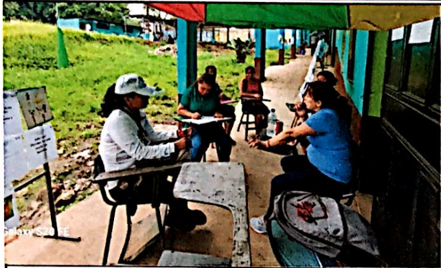
Foto1: Una breve reunión previo al recorrido del remozamiento finalizado.