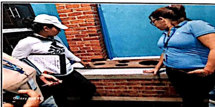
Foto 6: Estufa de leña rural mas chimenea y reparación de muros al 100% de ejecución.