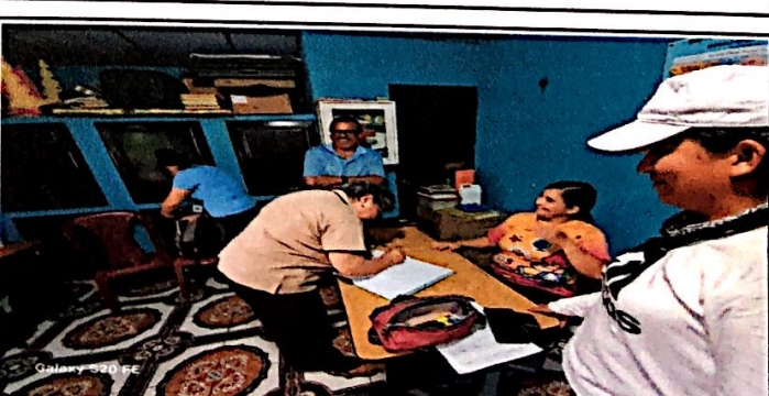
Foto 12: Recopilando firmas para el acta de finalización del programa de remozamiento.