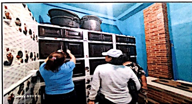
Foto 5: Remozamiento al 100% de muebles de cocina mas cambio de puertas de gabinetes.