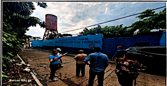
Foto 8: Evaluadora de campo y supervisora educativa observan el 100% de ejecución de Pintura en muro piremtral mas rotulación.