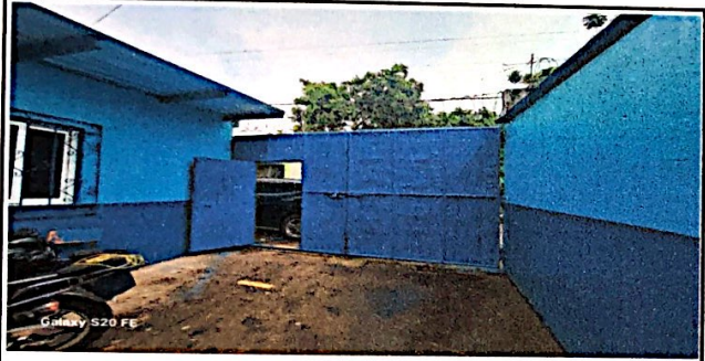
Foto 9: Mantenimiento en porton en exterior y interior finalizado.