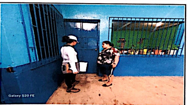
Foto 11: Herrería, reparación y mantenimiento de puertas y balcones en todo el establecimiento finalizado.