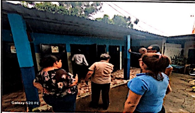
Foto 1: Evaluadora de campo y supervisora educativa supervisan el modulo de servicios de sanitarios dando el 100% de aprobación.