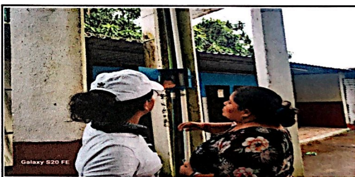
Foto 4: Suministro de conexión de tubería mas circuito eléctrico finalizado.