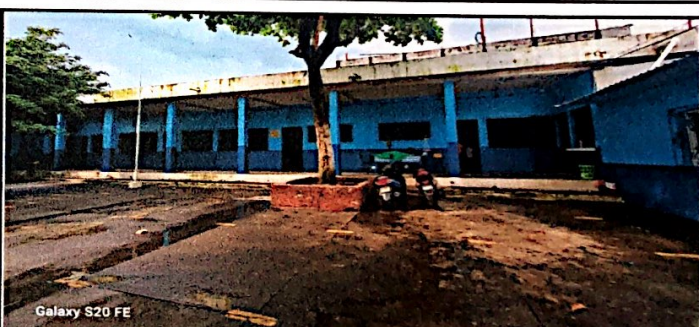
Foto 10: Se observó en el Remanente Pintura en exterior en el establecimiento al 100% de ejecución.