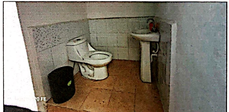
Foto 10: Mejoramiento en el baño de docentes, cambio e instalación de lavamanos y piso antideslizante finalizado al 100%