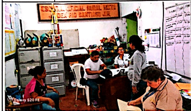
Foto1: Reunión previa al recorrido para recepción del programa de remozamiento.