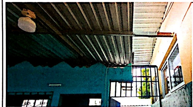
Foto 11: Cambio e instalación de lamina duralita por lamina troquelada aluzinc calibre 26 (incluye pernos) en el módulo de aulas, finalizada al 100%.