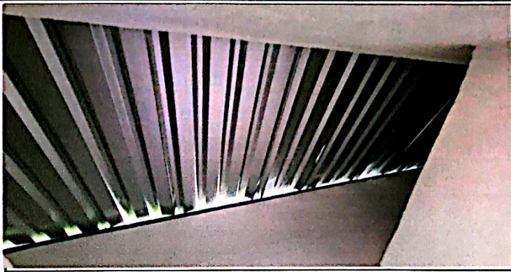
Foto2: Cambio e instalación de lamina por lamina troquelada aluzinc calibre 26 (incluye pernos) en el 1er módulo de baños. Finalizado al 100%