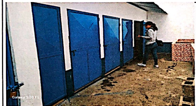
Foto 3: Reparación y mantenimientos de puertas metálicas en el 1er módulo de baños, finalizada al 100%