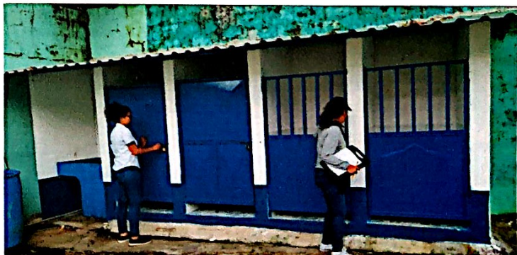
Foto 6: Herrería, Reparación y mantenimiento de puertas en el 2do módulo de baños, finalizada al 100%