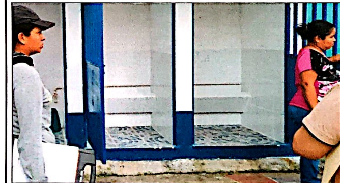
Foto 5: Cambio e instalación de llave para urinal y azulejos en el 2do módulo de baños, finalizado al 100%