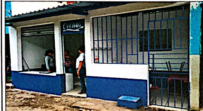
Foto 9: Herrería, Reparación y mantenimiento de puertas y ventanas en el módulo de cocina y tienda, finalizada al 100%