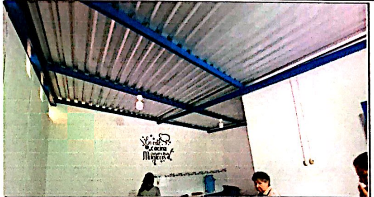
Foto 8: Cambio e instalación de estructura de soporte metal por metal y de lamina por lamina troquelada aluzinc calibre 26 (incluye pernos) en el módulo de cocina y tienda. Finalizada al 100%