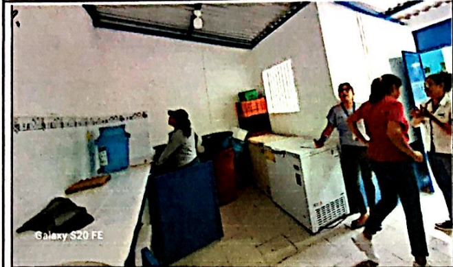
Foto7: Mejoramiento de cocina (modulo 5.20 m x 5.40 m) incluye remozamiento de muebles de cocina, azulejo, estufa de leña rural mas chimenea mas reparación de muros. Finalizada al 100%