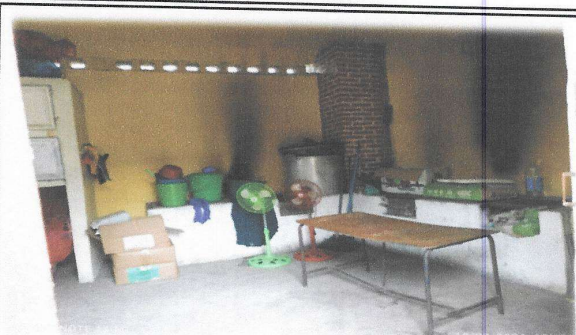
Foto 2: Solicitan multiples reparaciones en el modulo de area de cocina.