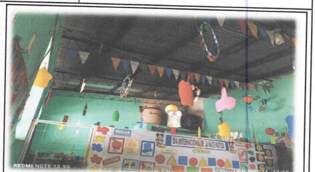
Foto 8: Sustitución de lamina ondulada por lamina troquelada aluzinc calibre 26, en modulo de aulas (interior) de 233.00 m 2