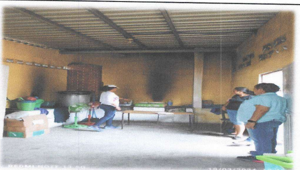
Foto 4: Reparacion de muebles de cocina, se solicita azulejo para dichos muebles.