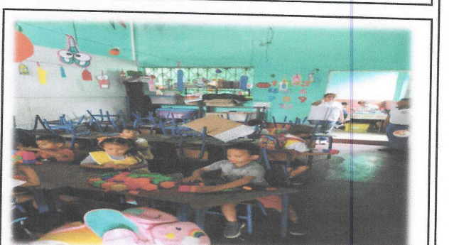
Foto 10: Reparación de aula con muro divisor entre el aula y pasillo, a muro de block.