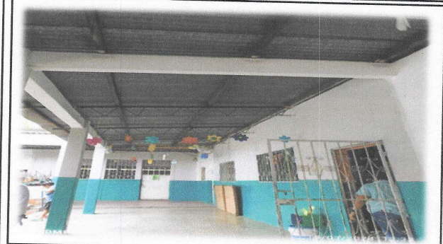
Foto 7: Sustitución de lamina ondulada por lamina troquelada aluzinc calibre 26, en modulo de aulas (exterior) de 233.00 m 2