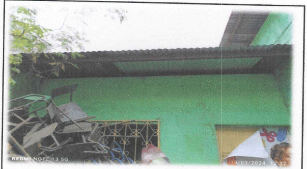
Foto 9: Sustitución de lamina ondulada por lamina troquelada aluzinc calibre 26, en modulo de aulas de 35.00 m 2