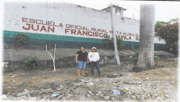
Foto 7: Sustitución de lamina ondulada por lamina troquelada aluzinc calibre 26, en modulo de aulas (exterior) de 233.00 m 2