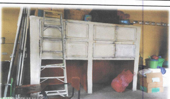
Foto 4: Reparacion de muebles de cocina, se solicita azulejo para dichos muebles.