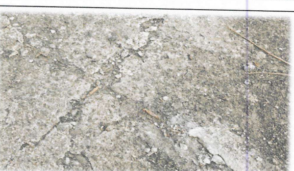
Foto 6: Foto tomada vista exterior de de grietas en losa de bodega