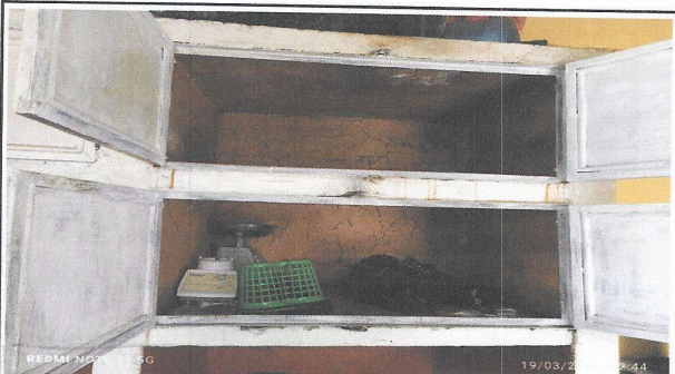
Foto 5: Estado actual de los gabinetes del mueble de almacenaje de alimentos e utensilios. Se necesita intervención para el mejor funcionamiento del mismo.