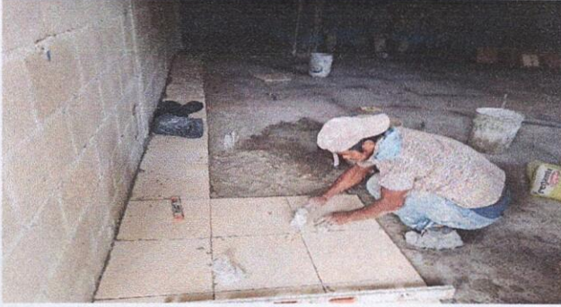
Foto1: sustitución de techo