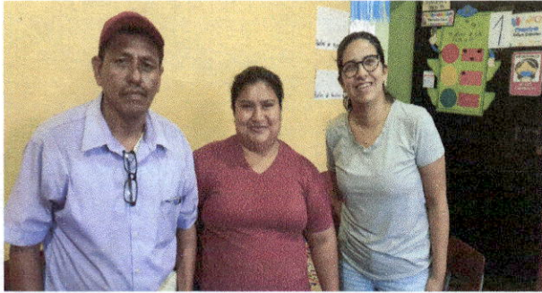
Foto1: Foto consultor, directora y OPF