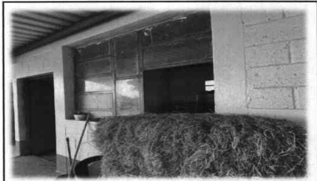
Foto 10: En el área de dirección se sustituirá la ventana actual por ventana de aluminio mill finish mas paleta de vidrio, ya que en temporadas de verano el lugar es caluroso y es necesario tener las ventanas abiertas, y las que posee actualmente algunos vidrios son fijos.