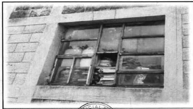
Foto 11: Por seguridad del establecimiento en el área de dirección lado frontal y posterior, se consideró colocar balcones.