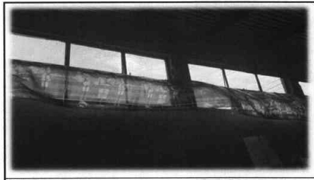
Foto 12: Por seguridad del establecimiento en el área de algunas aulas, se consideró colocar balcones.

_____ Firma y sello del Presidente de la OPF