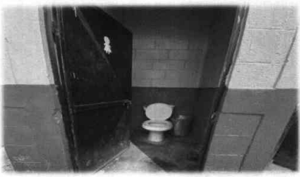
Foto 4: Cada cubiculo de los inodoros no cuentan con azulejo, por tal motivo se dificulta la limpieza de los mismos.