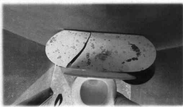
Foto 3: Actualmente se encuentran los inodoros deteriorados y quebrados, se contabilizaron cuatro unidades.