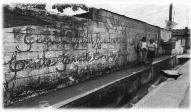
Foto 1: Presidente de la OPF y Evaluadora de Campo, realizando la visita técnica, para identificar las necesidades con mayor prioridad.