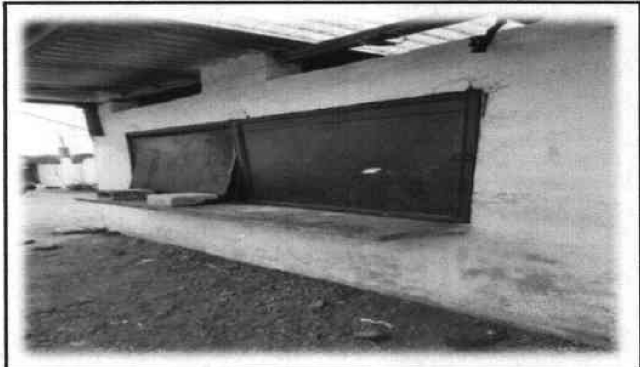
Foto 8: La cubierta de la cocina, estructura portante de madera/metal y lamina, se encuentra con deterioro, en especial la estructura de madera.