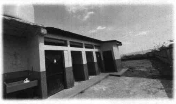
Foto 2: Múltiples reparaciones en el área de servicios sanitarios (niños, niñas y docentes)