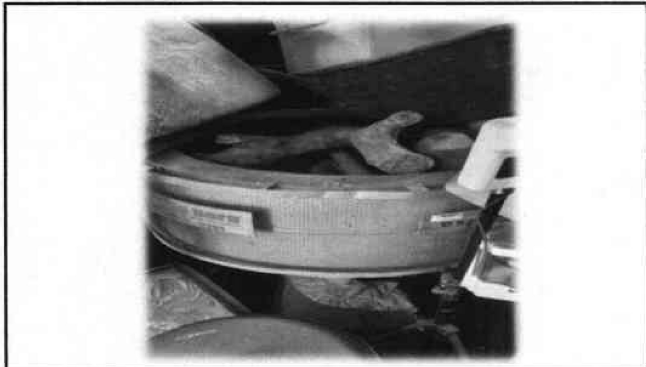
Foto 7: Sustitucion de estufa de metal por estufa de leña rural, incluye plancha de metal y chimenea.