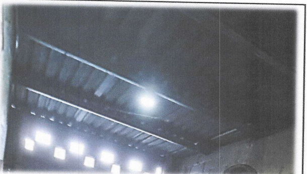
Foto 9: Mantenimiento e Instalación de estructura de metal, incluye lijado, pintura anticorrosiva y cambio e instalación de lámina troquelada aluzinc calibre 26. incluye tornillos.