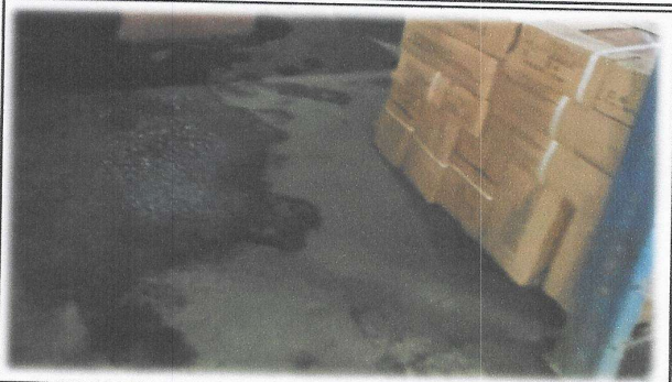
Foto 7: Es necesario el cambio e instalación de piso antideslizante en el módulo de cocina.