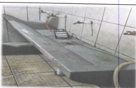
Foto 4: Mejoramiento de servicios sanitarios dos, Incluye reparación, cambio de tubería, artefactos, accesorios y azulejo.