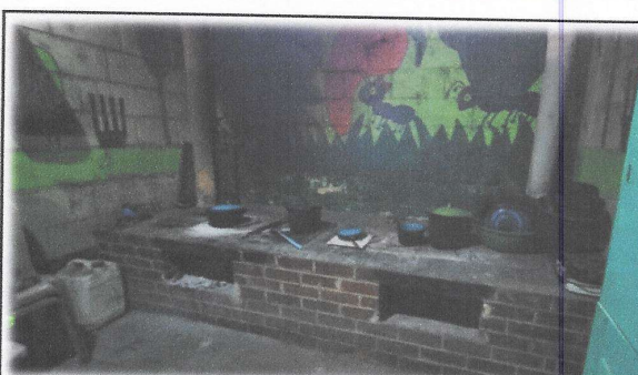
Foto 6: Mejoramiento de cocina, incluye remozamiento de estufa de leña rural, muebles fijos de concreto, y azulejo.