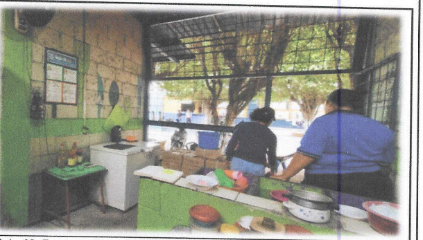
Foto 12: Proceso de registro de necesidades prioritarias durante la evaluación de campo.