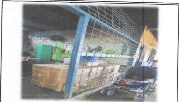
Foto 8: En el módulo de cocina es necesaria la reparación y mantenimiento de puertas, balcones y puertas de gabinetes.