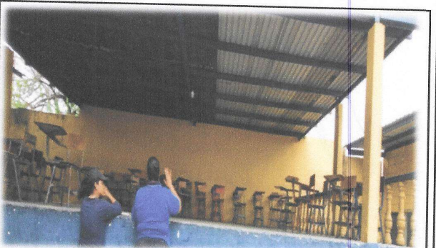
Foto 10: Es necesario el cambio e Instalación de estructura de metal, incluye lijado y pintura anticorrosiva en el módulo del escenario.