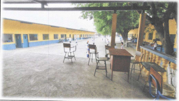
Foto1: Escuela Oficial Rural Mixta, Gonzalo Adolfo Santizo Santizo.