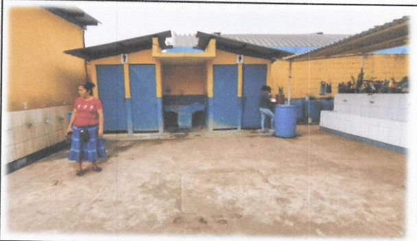
Foto 3: Mejoramiento de servicios sanitarios uno, Incluye reparación, cambio de tubería, artefactos, accesorios y azulejo y bebederos.