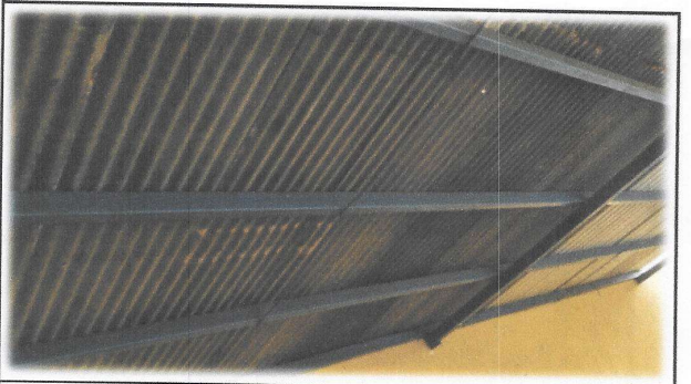
Foto 11: Es necesario el suministro e Instalación de lámina troquelada Aluzinc calibre 26 (incluye tornillos) en el módulo del escenario.