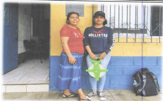
Foto 2: Presidente de la OPF y Evaluadora de Campo, realizando la visita técnica para identificar las necesidades con mayor prioridad.