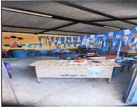
Foto1: sustitucion de piso ceramico en tre aulas