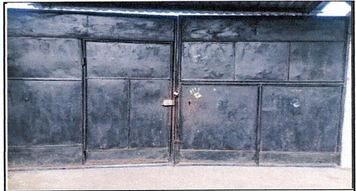
Foto 6: Mantenimiento de portones de metal y colocacion de pintura

Observación: Si es necesario se pueden agregar hojas adicionales y actualizar el número de hojas.