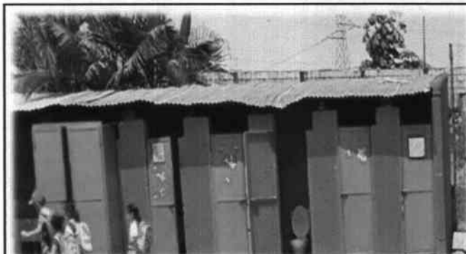
Foto 4: Cambio e instalación de estructura de soporte de metal por metal y cambio e instalación de lámina, por lámina troquelada aluzinc calibre 26 (incluye tornillos) en el módulo de baños.