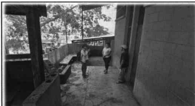
Foto 3: Directora del plantel educativo participando en la visita técnica para identificar las necesidades prioritarias.