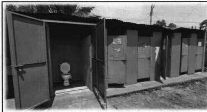
Foto 5: Existe la necesidad de reparación y mantenimiento de puertas.