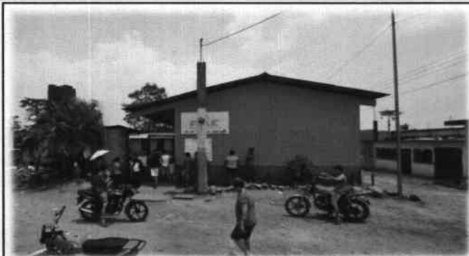
Foto1: Escuela Oficial Rural Mixta, colonia Morela.