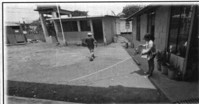
Foto 11: Proceso de medición y creación de registros por parte de la Evaluadora de Campo.