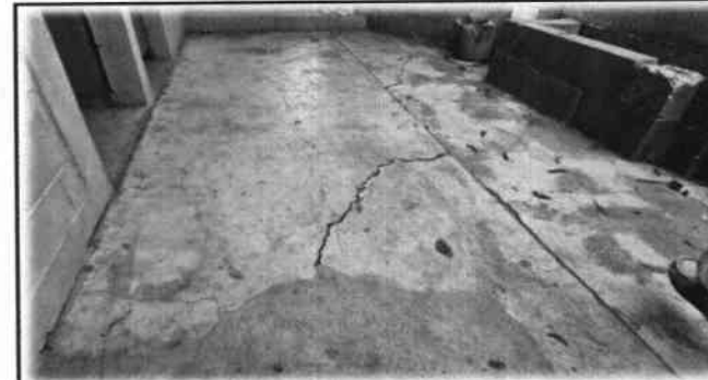
Foto 12: Es necesario el cambio e instalación a piso antideslizante en el corredor de la escuela.