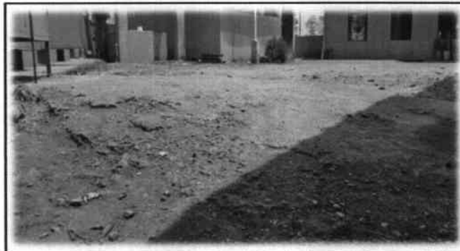
Foto 6: Es necesario el cambio e instalación de planchas de concreto de patio.