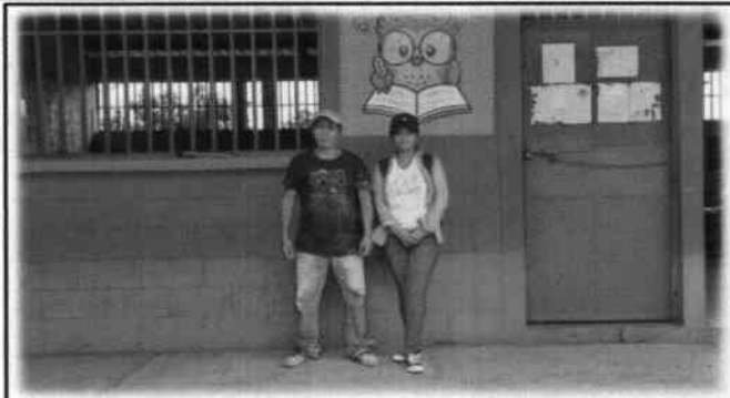
Foto 2: Presidente de la OPF y Evaluadora de Campo, realizando la visita técnica para identificar las necesidades con mayor prioridad.