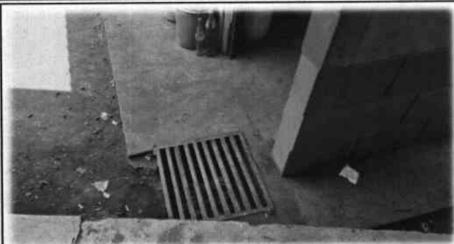
Foto 7: Se detecta la necesidad del cambio e instalación de cuneta y drenaje pluvial..