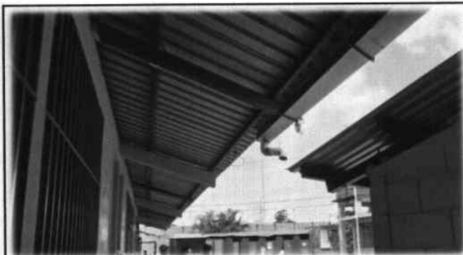
Foto 9: Es necesario el cambio e instalación de soporte para canal PVC.