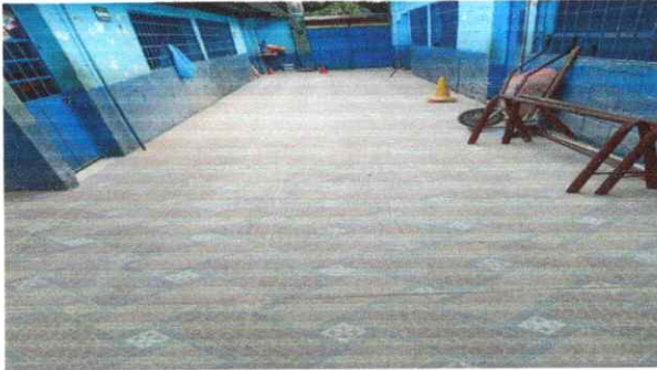
Foto1: Reparación de piso de torta de concreto