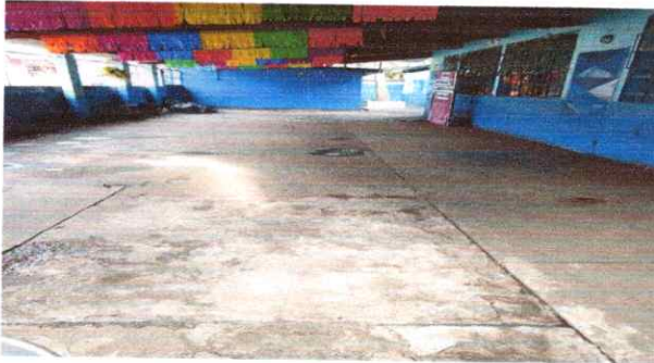
Foto1: 6.1 Reparación de piso de torta de concreto