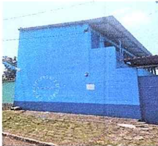
Foto1: Sustrucción de lámina , por lámina troquelada aluzinc calibre 26' segundo nivel y pintura de exterior de escuela.