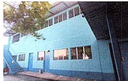
Foto 6: Pintura de muros exteriores e interiores y sustitución de chapa de puerta

Observación: Si es necesario se pueden agregar hojas adicionales y cambiar el número de hojas.