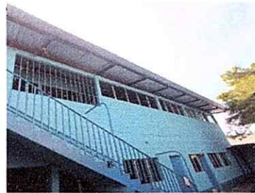
Foto 4: Mantenimiento a baranda de metal y pintura de exterior de la escuela