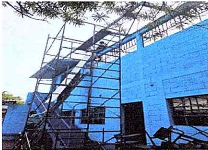
Foto1: Sustitución de lámina , por lámina troquelada aluzinc calibre 26' segundo nivel y pintura de exterior de escuela.