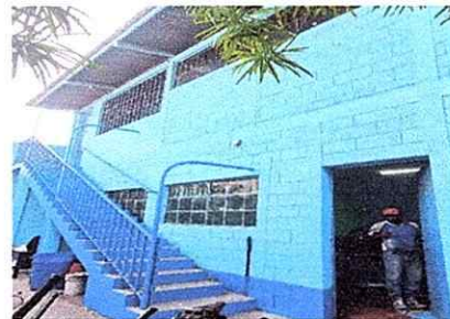
Foto 6: Pintura de muros exteriores e interiores y sustitucion de chapa de puerta

Observación: Si es necesario se pueden agregar hojas adicionales y actualizarlas.